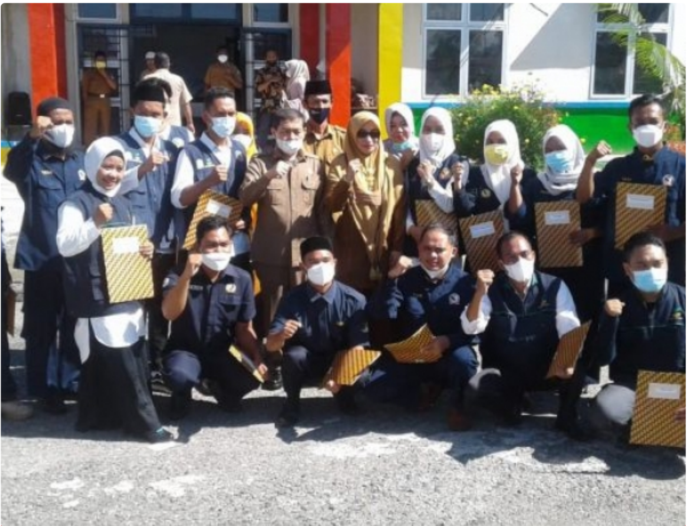
Gambar : Sekda Aceh Tenggara Poto Bersama 16 Anggota TKSK

Aceh Tenggara - Sekretariat Daerah (Sekda) Kabupaten Aceh Tenggara mengukuhkan dan sekaligus membagikan Surat Keputusan (SK) kepada 16 orang Tenaga Kesejahteraan Sosial Kecamatan (TKSK) se-Kabupaten Aceh Tenggara, di Depan Kantor Dinsos Aceh Tenggara. Selasa (12/04/2022).